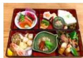
※季節や仕入れ状況などにより 内容が変わります

4~5名様向けの色々入った2段弁当♪ 少人数様向け お弁当プラン 一人様 税込 3,000円