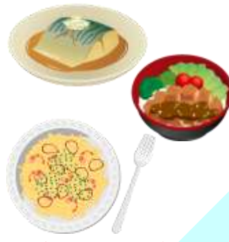
※各イラストはイメージとなります

サバ味噌定食 600円 (香物、サラダ、ご飯、味噌汁) ホツケ塩焼き定食 680円 (香物、サラダ、ご飯、味噌汁) メカジキのカツ丼 900円 (香物、味噌汁) シーフードパスタ 1,000円 (サラダ)