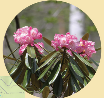
アズマシャクナゲ 6月