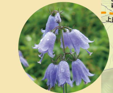
ツリガネニンジン 8月