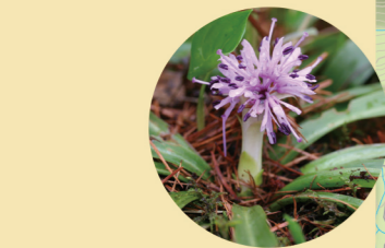
ショウジョウバカマ 5月

籠ノ登とは不思議な名前ですが、かつて山が信仰の対象であった頃、天に最も近いところという意味から「加護の塔」(神の力を授かる高い場所)と名付けられたともいわれます。浅間山から富士山、八ヶ岳、北アルプス、遠く日光山系まで、360度のパノラマが楽しめます。