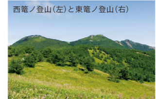
西籠ノ登山(左)と東籠ノ登山(右)