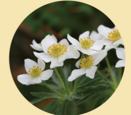
ハクサンイチゲ 6月

つつじ平のレンゲツツジ大群落は、国の天然記念物にも指定され、初夏6月下旬には湯ノ丸山の山肌を鮮やかな朱色の絨毯のように染め上げます。