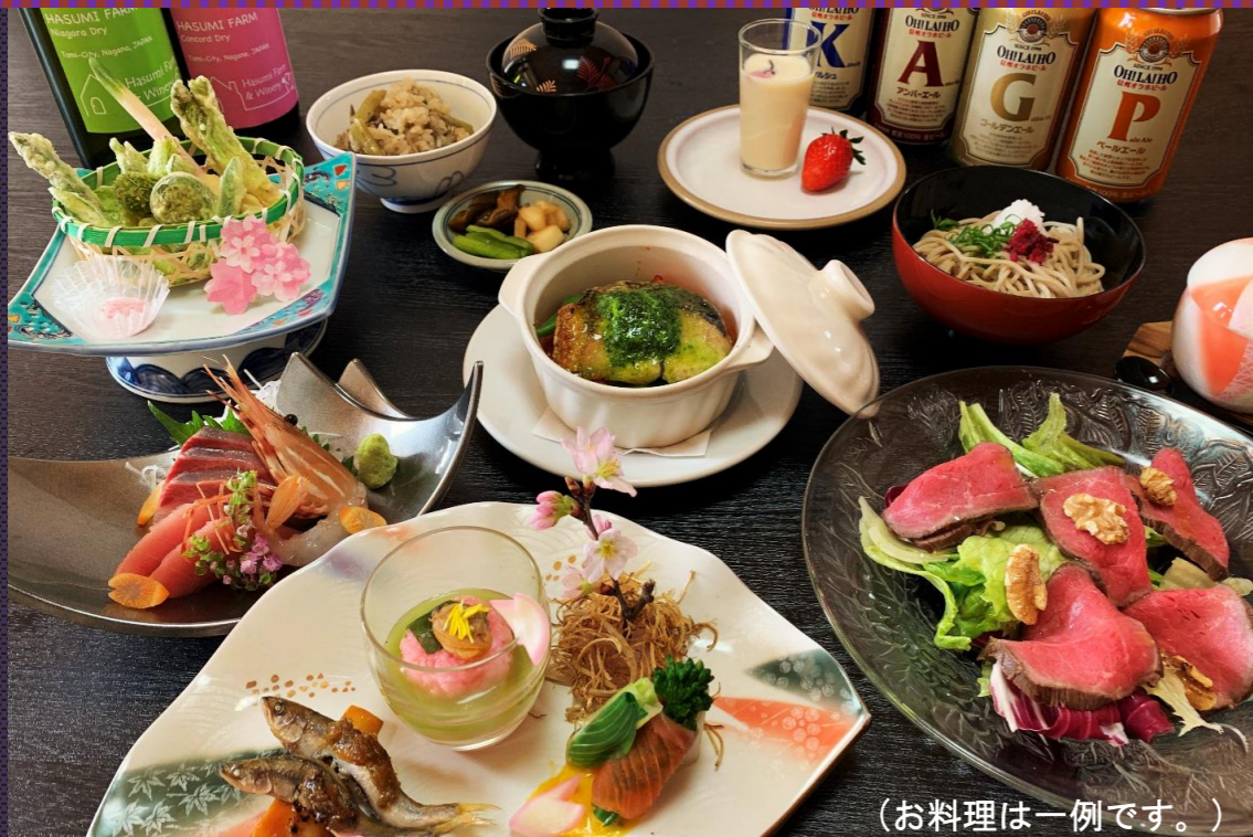
(お料理は一例です。)