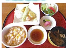
季節の定食 夏野菜の天麩羅と とうもろこしごはん 680円