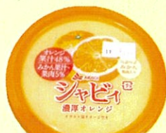
シャビィオレンジ 130円