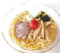
冷やしラーメン 650円