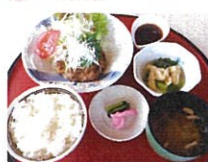
ゆうふる御膳 和風おろしハンバーグ 850円