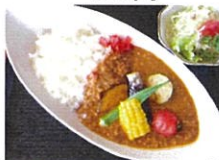
夏野菜カレー * サラダ付き 750円