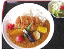
夏野菜カツカレー * サラダ付き 980円