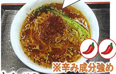
しょうゆベースの ゆうふる特製担々麺 700円