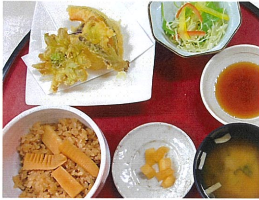
季節の定食 700円 たけのこご飯と季節の天麩羅