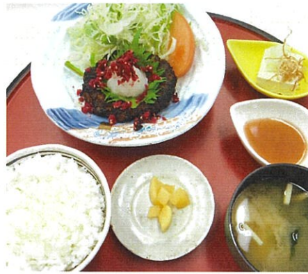
ハンバーグ定食 880円 カリカリ梅とおろしハンバーグ