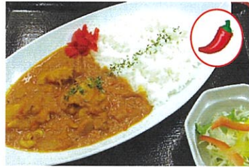
スパイス チキンカレー 750円