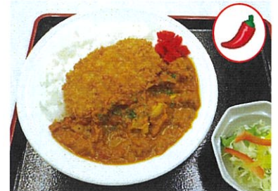
スパイスチキンカレー 豚カツのせ 980円