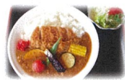
夏野菜カツカレー 950円