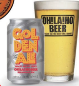
「オラホビール ゴールデンエール」 銅賞