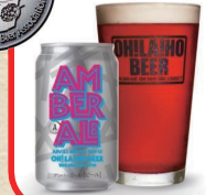
「オラホビール アンバーエール」 銀賞

いつも応援して下さいの皆様、本当にありがとうございます。 さらに素敵なビールをお届けできるよう、日々頑張りますよ〜! 今後ともよろしくお願ひ致しますm(_ _)m オラホビールスタッフ一同