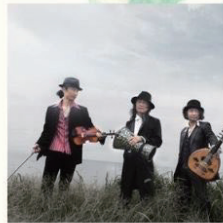
国境なき民族音楽団 シャルキイロマ

山口県出身。中国音楽院留学として上海音楽学院龍音杯国際二胡コンクール優秀賞・表演賞受賞。2017年イタリア・サルデーニャ国際民族楽器JAZZフェスティバル招聘アーティストとなり、現地の音楽活動を浴びた。2019年より東御市在住。地域と融合しながら楽しむ音楽活動を求めている。様々な演奏活動を展開中。