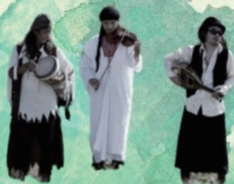
シャルキイロマ (アラブ音楽)