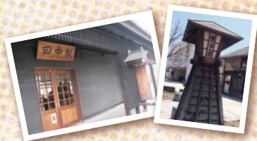
現在も田中商店街に残る田中宿の灯籠

明治21年田中駅開業。この頃、製糸業が栄え、繭糸が岡谷方面より和田峠を越えて田中駅に集まってきた。繭糸は田中駅から鉄道で横浜へ運ばれ、海外へ輸出された。 また田中駅から岡谷方面にはポイラーの燃料が運ばれ、貨物や旅客の往来で大変賑わった。