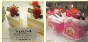
ショートケーキ 350円 さくら苺ロール 370円