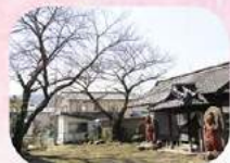
春は田中に王像の桜も見ごたえあり

3度目の東御市の春を迎えましたが、同じ季節を迎えても毎年違う景色や気候を体験し、新鮮な気持ちになります。桜の名所もあまり知られていない穴場などがまだあります。今回は写真が無く残念ですが、田中駅から春のおさんぽがてら散策してみてください。きっと自分だけが知る新しい発見に出会えるかも。私もまだまだ東御の魅力を追求し続けていきたいと思います。