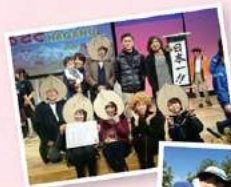
受賞後 スタッフで 記念撮影！

ふるさとCM大賞NAGANOのホームページでもご覧になることができますので、皆さん是非見てみてください。