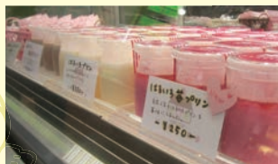
はるいろ苺プリン 250円