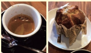
エスプレッソ 350円 マフィン 350円