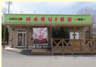
茶、緑、ピンクはお店のメインカラー

お土産にお持ち帰りもしても喜ばれること間違いなし。ケーキの箱を開けた人達の笑顔が浮かんできます。