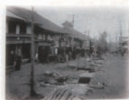
田中の町並み (昭和4年)