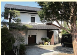
白いのれんと瓦屋根が目印

カレーやサンドイッチの軽食もあり、自家製マフィンやパウンドケーキは季節ごと東御のフルーツが盛り込まれる予定。是非エスプレッソと一緒に味わいたい一品です。テイクアウトも可。