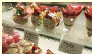
定番からオリジナリティ溢れるケーキまで彩り豊かなスイーツが勢ぞろい！