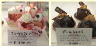
フルーツシフォン 370円 ドームショコラ 380円