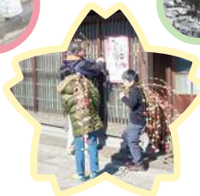
▲地元の子も連と「稲の花」を飾り付け