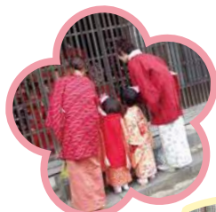
▲着物でお祭りを楽しむ人々

旧北国街道海野宿の各家の軒先に、何百体もの雛人形が飾られます。江戸時代から代々受け継がれてきた貴重な物から、現代の物、つるし雛まで様々。普段見ることの出来ない玄関や表の間にも飾られ、格子越しに自由に見学できます。そしてなんととっても幻想的なのは、日没につれてライトアップされた雛人形が海野宿を彩る景色。一味違った雰囲気を感じてみてください。