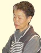
ホールを仕切ってお母さん

営業時間 昼 11:00 ~ 13:00 夜 17:00 ~ 21:00 定休日 日曜日 TEL 0268-64-2366 住所 東御市田中 70