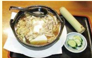
鍋焼ききしめん 700円