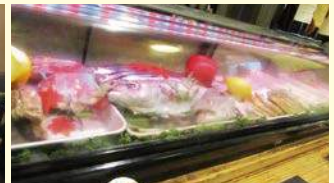
カウンターの目の前には新鮮な食材が並び