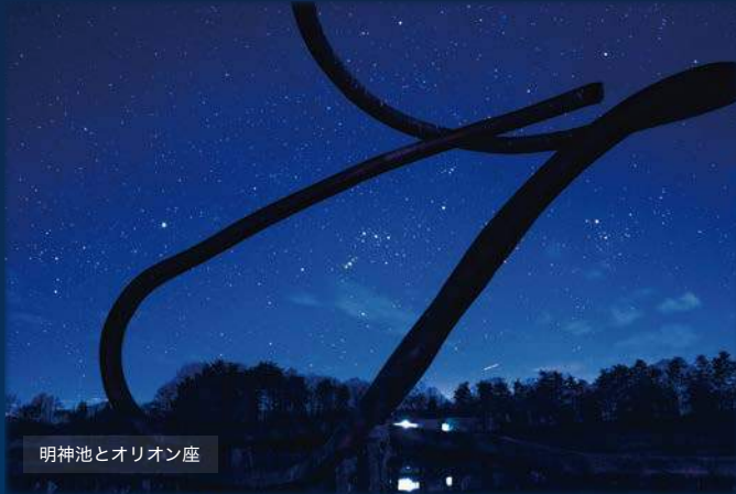
明神池とオリオン座