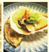
北海道産殻付き 生がき 580円