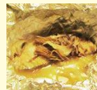
秋鮭と茸の味噌バター ホイル焼き 780円