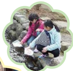
▲海野宿の水路で流し雛