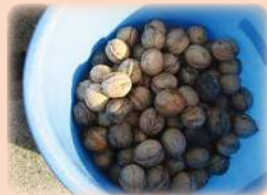
田中駅前の採れたてクルミ