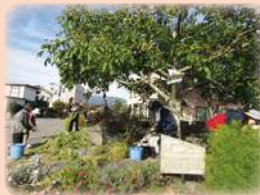
10月初旬クルミ収穫の様子

「長い竹の棒で叩いて落とす」。この時期はあらゆる場所でこの光景を見る事ができます。雨が少なく日照時間が長い東御の気候で育った良質なくるみは自慢の特産品のひとつです。