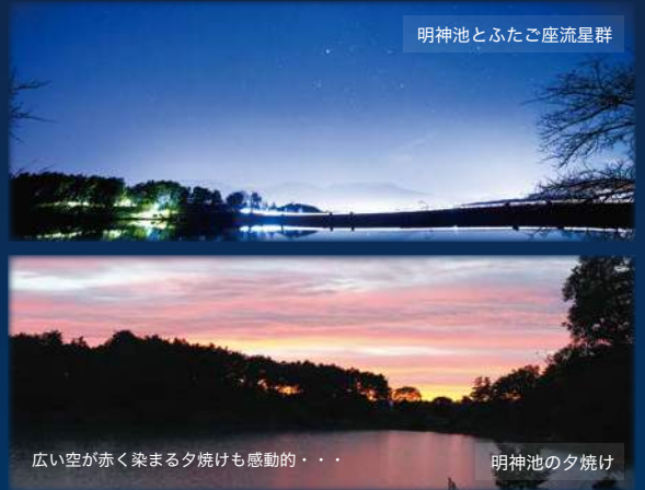
明神池とふたご座流星群