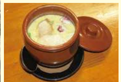
ボリューム満点のたこつぼ