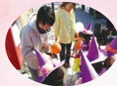
可愛いおばけたちが 観光ステーションにきてくれました！