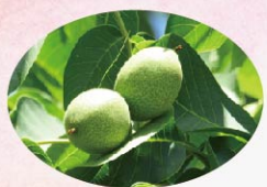
田中駅前のクルミ