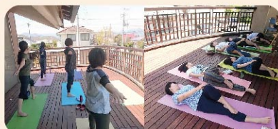
写真は前回のそらヨガの様子です。