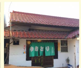
緑ののれんが目印です