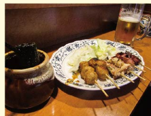
手前の壺から秘伝のタレをたっぷりかけて！