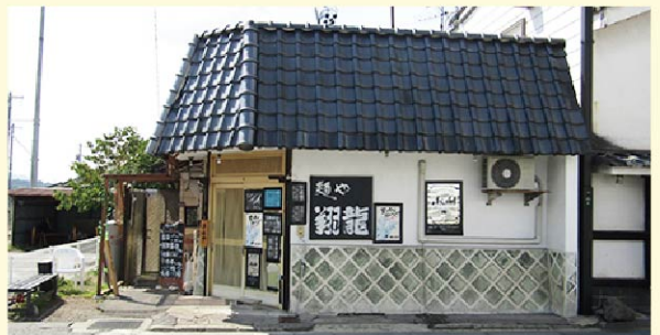
青い瓦屋根と大きな看板が目印