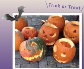
まちを賑やかにするカボチャたち

10月のハロウィンに向けて田中のまちなかでは様々な場所でオバケカボチャが登場。またクリスマスの頃には田中駅前 の クルミの木もイルミネーションでキラキラ輝きます。