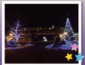
昨年の田中駅前イルミネーション