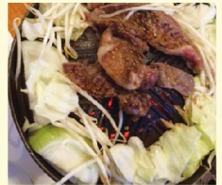
お肉が焼いたら秘伝のタレをたっぷりつけて!