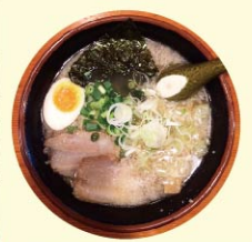
豚骨醤油らーめん 750円