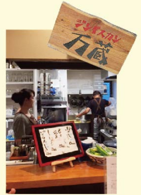
ご主人も調理場でサポート