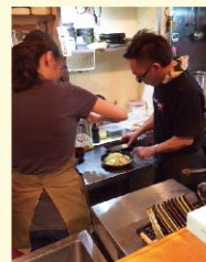
隠し味はご夫婦の愛情!?