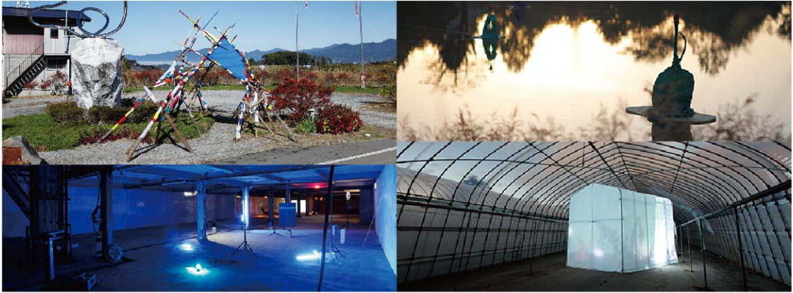
昨年の芸術祭の作品

掲載情報は2017年10月現在のものです。イベント内容などは変更となる場合がございますのでご了承ください。