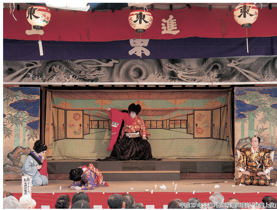
平成27年公演「御所様堀川夜討「弁慶上巻」