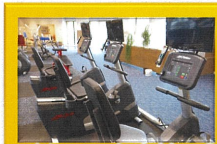
リカンベントバイク×3