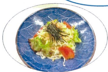
さっぱり! ツルっと。 サラダうどん 750円