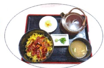
夏バテ解消に!! ひつまぶし定食 900円 本日のきまぐれスパゲティ 800円