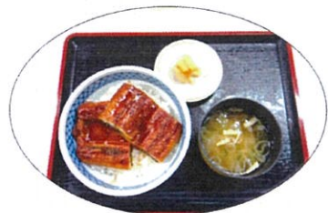
夏のスタミナ補給! うな丼 1000円