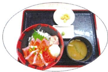
信州の味覚をゆうふるで。 信州サーモン丼 900円 小盛り 850円