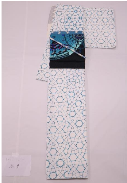
レンタル着物 帯・帯付・半着 No.9