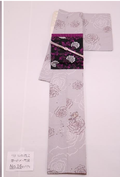
レンタル着物 帯・帯付・半着 No.16