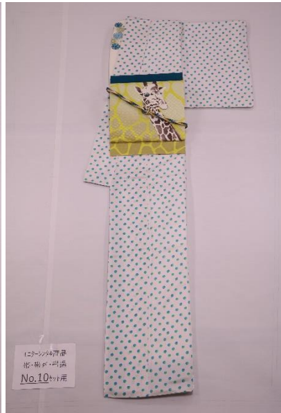
レンタル着物 帯・帯付・半着 No.10