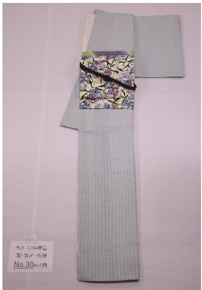
レンタル着物 帯・帯付・半着 No.30