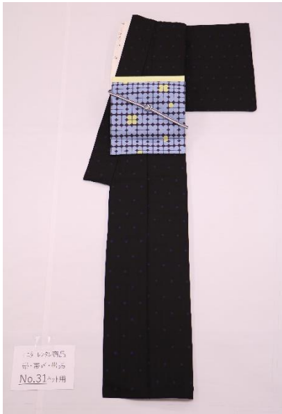
レンタル着物 帯・帯付・半着 No.31