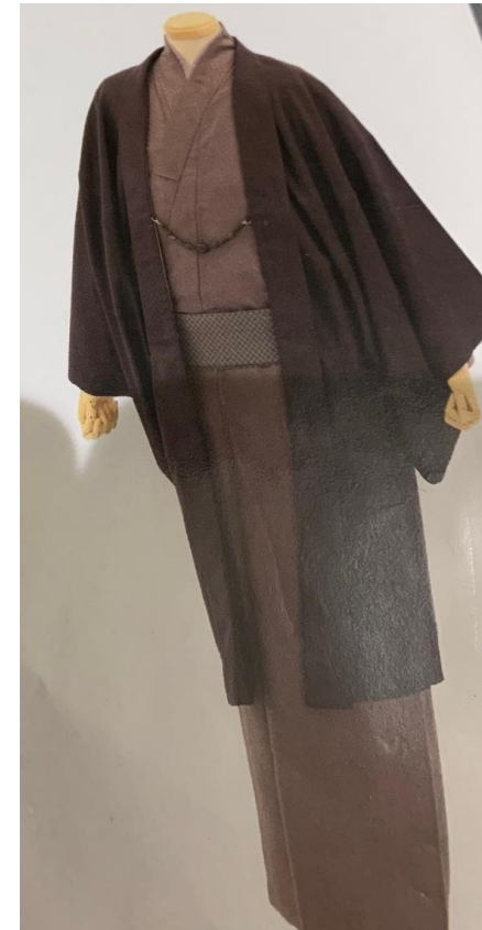
男性アンサンブル見本