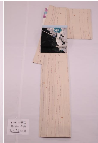
レンタル着物 帯・帯付・半着 No.24