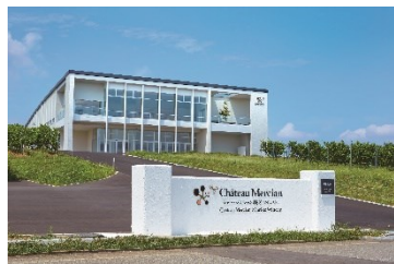
メルシャン椀子ワイナリー