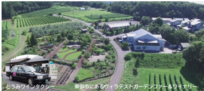
とうみワインタクシー