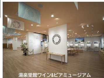
湯楽里館ワイン&ビアミュージアム