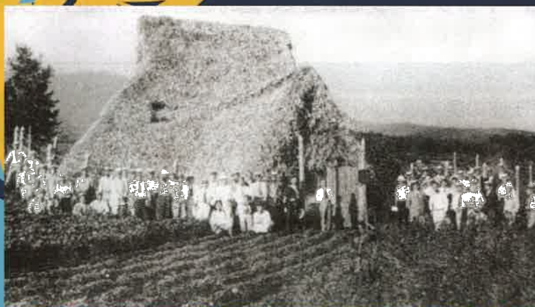
昭和5年に建てられた日本初の保護屋蓋