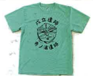
保存会オリジナルTシャツ 定価 1,500 円

東御市内で発見された土偶をモチーフに東御市在住の美術家 OKi デザインの「ハラグチさん」と成立・寺ノ浦石器時代住居跡保存会のコラボオリジナルTシャツが完成! 購入希望の方は、事務局までお問い合わせください。色: ライム、サイズ: M・L・LL 定価 1,500 円(会員価格 1,000 円)