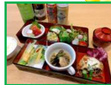
※写真は竹弁当です