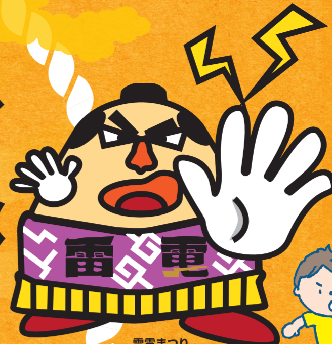
雷電まつり 公式キャラクター「らいどん」

雷電為右衛門 たいてんためえもん 雷電為右衛門は、254勝10敗、勝率9割6分2厘の大相撲史上最強の力士。1767年、東御市滋野生まれ。身長約2m、体重約169kgとされている。