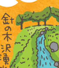
御膳水公園 本陣と水辺が豊富にある御膳水公園。木音に癒されながら散歩も◎