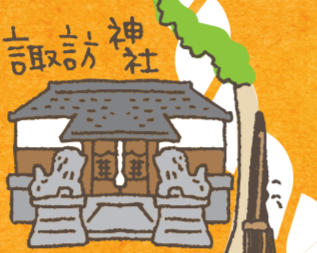
大きな狛犬と楯に見守られた諏訪神社