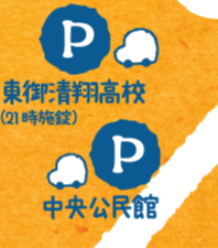
東御市役所 中央公民館