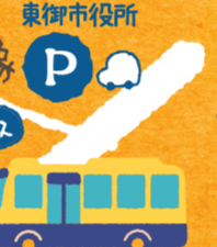
送迎バス専用駐車場