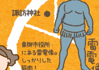
東御市役所にある雷電像。しっかりした筋肉!